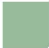
VERDE G GREEN G VERDE G