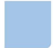
AZUL G BLUE G BLU G