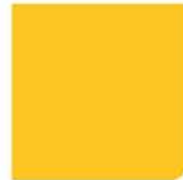
AMARILLO G YELLOW G GIALLO G